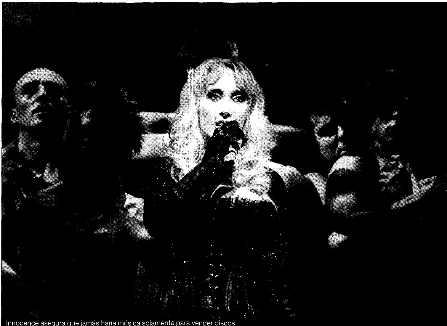
Innocence asegura que jamás haría música solamente para vender discos.

La cantante ha hecho de sus conciertos todo un espectáculo en el que música y puesta en escena cobran la misma importan-