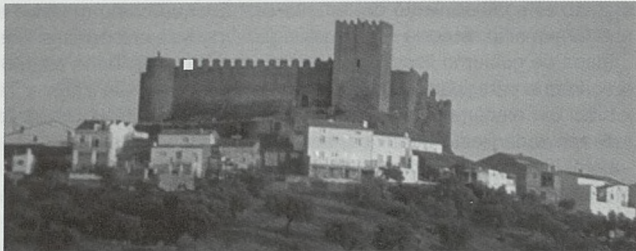
Castillo de Segura de León

La zona terminará, en el siglo XV, articulada en dos "Partidos", el de Mérida, con las encomiendas de Ribera del Fresno, Alange, Almendralejo, Lobón-Montijo, Villafranca de Barros y Montánchez, y el de Llerena, con las de Azuaga, Bienvenida, Calzadilla, Fuente del Maestro, Hinojosa del Valle, Hornachos, Medina de las Torres, Monesterio, Montemolín, Palomas, Puebla de la Reina, Puebla de Sancho Pérez, Reina, Los Santos de Maimona, Trasierra, Usagre, Valencia del Ventoso, con Segura de León, castillo construido por la Orden a cuya puebla dio el fuero de Sepulveda en 1274, como Encomienda Mayor con el monasterio de Calera de León, más Jerez de los Caballeros, que pertenecía a la Mesa Maestral. (GARRIDO 1989)