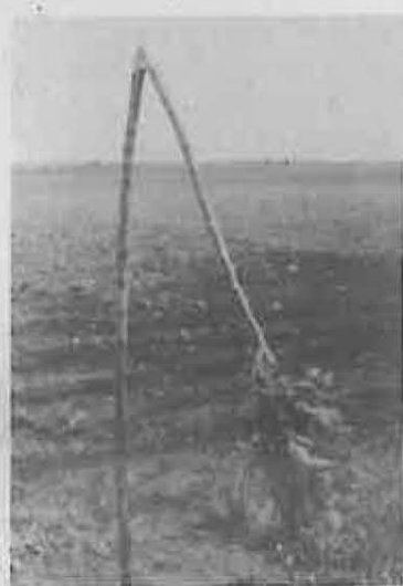
tuirse las marras hasta el año siguiente.

- Un árbol apenas tiene un coste económico considerable, pero estas acciones retrasan enormemente los trabajos de repoblación, al no poder susti-