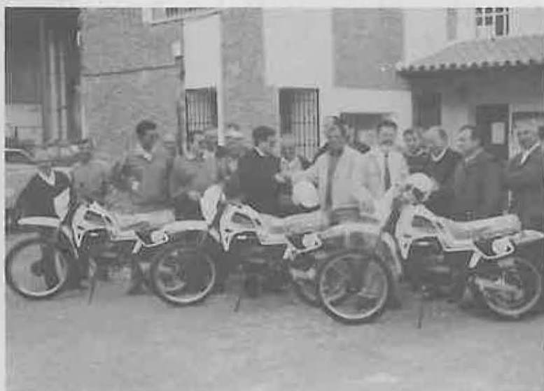
tres ciclomotores para este servicio.

Por otro lado, hasta ahora estos trabajadores tenían que utilizar vehículos propios para realizar su trabajo. Este problema queda resuelto definitivamente ya que el Ayuntamiento ha adquirido