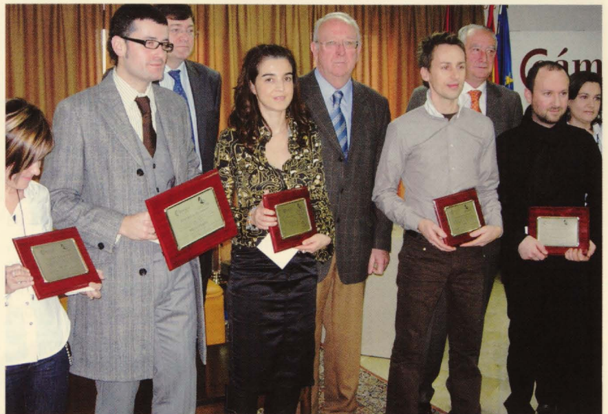
Los ganadores de los distintos premios muestran sus galardones.

En la III edición de este Concurso de Escaparates Navideños, se ha introducido una novedad; recogidas las imágenes