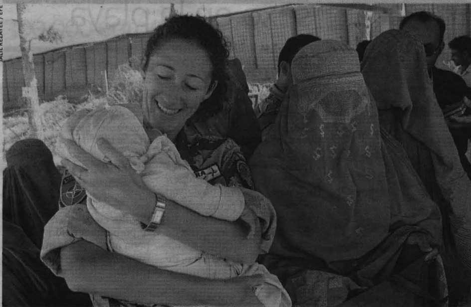
Una soldado española juega con un bebé en la base militar de las tropas internacionales de la OTAN en la localidad afgana de Herat. Allí, la población recibe tratamiento médico.