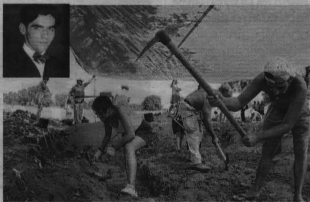
Miembros de la Asociación para la Recuperación de la Memoria trabajan en una fosa. Arriba, el poeta Federico García Lorca.