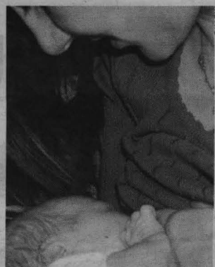
El taller informará sobre los beneficios de la lactancia.

Cooperación al Desarrollo de C-LM, que se celebran en Albacete bajo el lema Claves para entender los conflictos en el siglo XXI . METRO