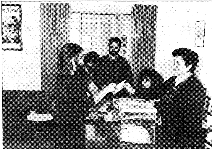
A las doce del mediodía, en el Psiquiátrico, había votado el 55%.

Entre las sesiones que realiza el Centro destaca las dieciséis sesiones informativas de técnicas de búsqueda de empleo (SITBE), durante los meses de octubre y primera quincena de noviembre, con la asistencia de 285 mujeres, en su gran mayoría demandantes del primer empleo. Hay que recordar que la información que da el Centro es gratuita y anónima, y se puede hacer personalmente, por teléfono o por carta.