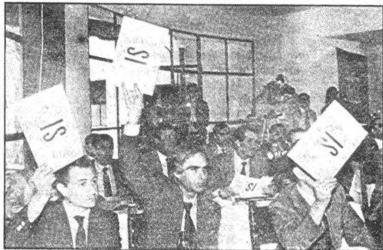
La votación del borrador presentado por UCD arrojó el siguiente resultado: 85 votos afirmativos y 1 en contra, todos de la UCD, y la "no votación" de socialistas y comunistas.

"Este proyecto de estatuto -valoró el presidente regional es un texto correcto, hecho sin prisas y adaptado a las características de nuestra región, en el marco de los pactos políticos y de las sugerencias de la comisión de expertos". "Evidentemente el texto es mejorable -siguió diciendo- y puede perfeccionarse a través de las enmiendas que hayan de presentar al mismo, en días sucesivos, los miembros de esta Asamblea de los diferentes grupos políticos".