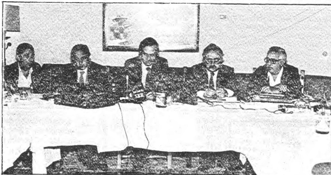
Plana mayor de la UCD regional. Estos hombres tienen en sus manos el futuro político de Castilla-La Mancha; ellos decidirán sobre el Estatuto de autonomía.

Organización territorial. Pueden existir integraciones. La de dejarse una puerta abierta para futuras incorpora-