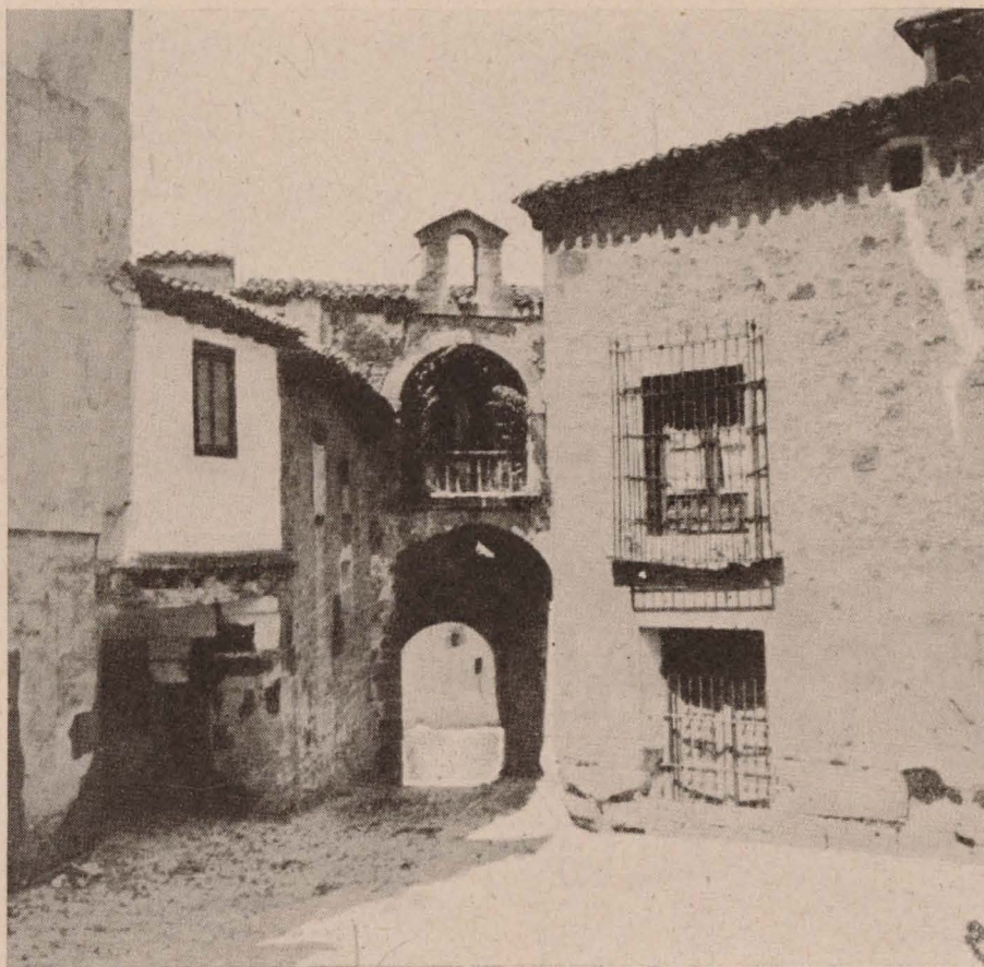
Puerta de la antigua muralla de Sigüenza.