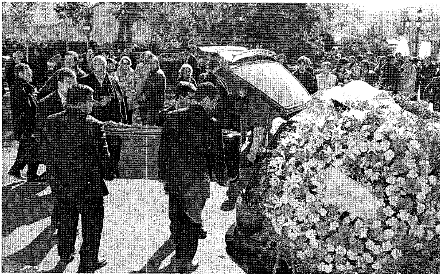
Imagen del funeral del trabajador de Repsol fallecido en accidente laboral. Millares de personas le dieron la despedida en Puertollano.