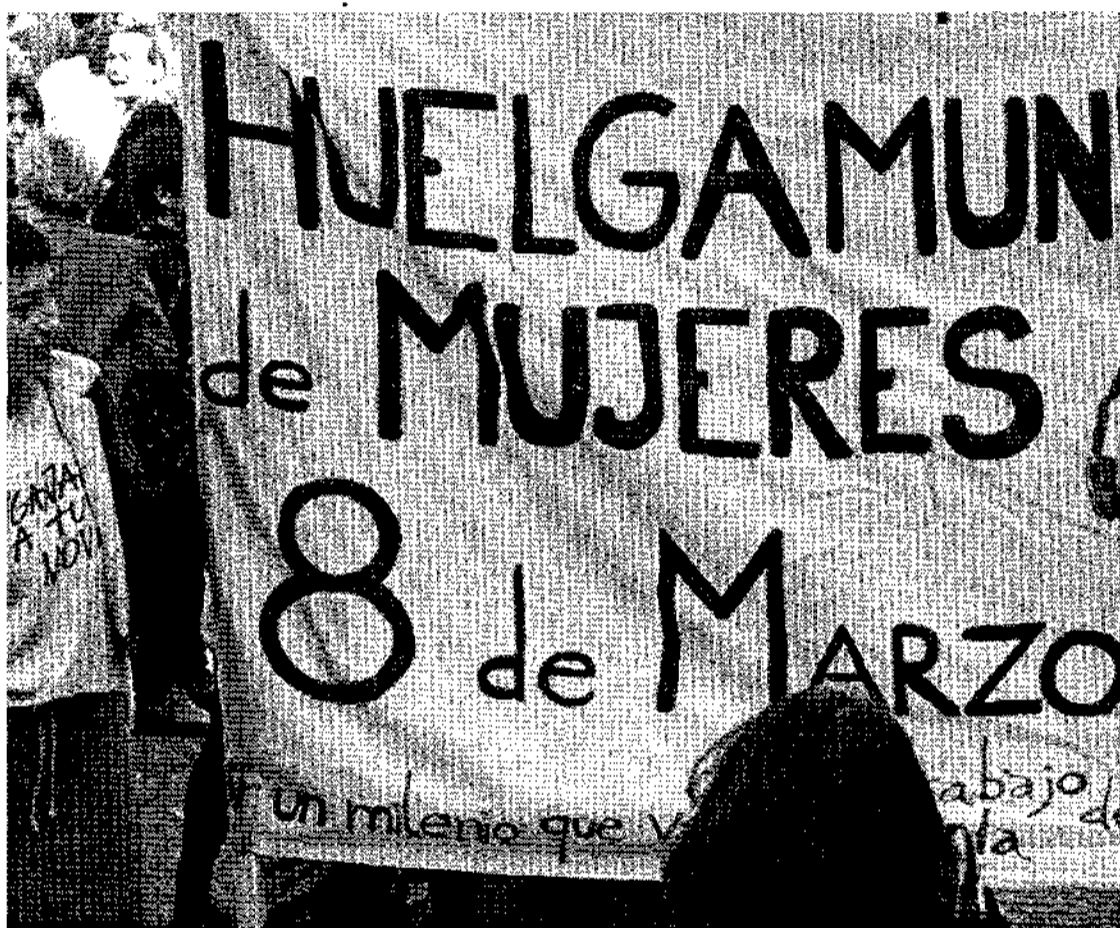
A lo largo de este año ha habido un incremento en el número de denuncias por malos tratos.

Según Llanos, en el primer semestre del año se ha producido un incremento considerable del número de denuncias respecto al pasado año en la región pero eso no significa, a su juicio, que haya aumentado