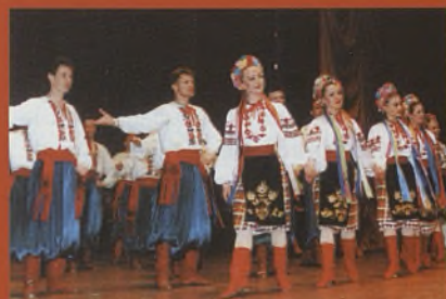
Espectáculo musical Coro, Ballet y Orquesta del Ejército Ruso

Jueves 26 de octubre 21:00 h. Teatro de la Paz. Albacete