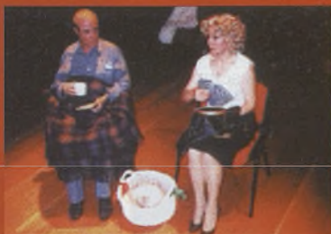
Grupo de Teatro Alfar De la Chelo a la Bilbao

Sábado 21 de octubre 19:00 h. Casa de Cultura. Fuente Alamo Miércoles 11 de octubre 20:30 h. Casa de Cultura. La Roda Sábado 28 de octubre 20:30 h. Auditorio Municipal. Munera