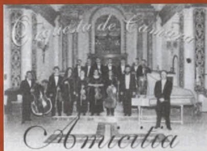
Concierto Orquesta de Cámara Amicitia Homenaje a The Beatles

Viernes 20 de octubre 20:30 h. Teatro Victoria. Hellín