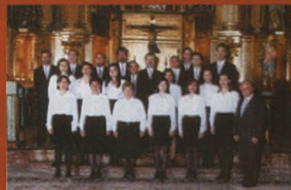
Musica coral Capilla Clásica de Murcia

Jueves 26 de octubre 21:00 h. Teatro de la Paz. Albacete