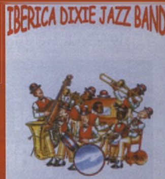
Concierto de jazz Iberica Dixie Jazz Band

Jueves 26 de octubre 20:30 h. Casa de Cultura. Hellín