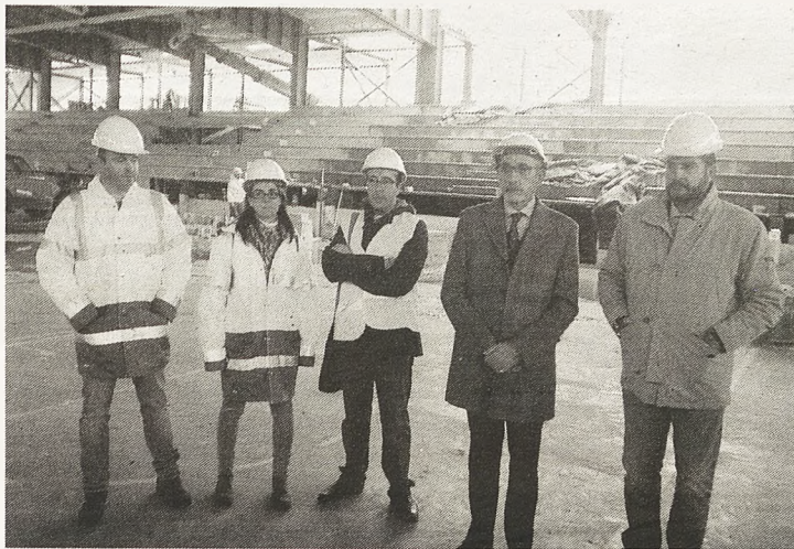
Un momento de las declaraciones en el pabellón de la Avenida del Sur que se está ampliando

También se están construyendo bajo las nuevas gradas vestuarios masculinos y femeninos, área de despachos, un almacén de cerca de 500 metros cuadrados y una salida de emergencia adicional. "La complejidad de la obra ha