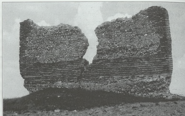
Torre de Piteos

Los restos constan de un paredón de 9,20 metros de