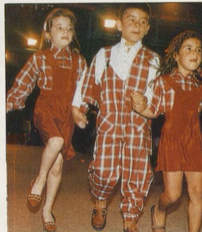
El pase resultó sanamente informal. Esta imagen es una buena muestra de ello.

Los colores fueron atrevidos una vez más. Se olvida y obvia lo tenue para lanzarse a las propuestas más intensamente reveladoras en cuanto a tonalidades. Las tendencias presentadas, a pesar de su toque de los años 70 y su vanguardia, guardan un respeto considerable con los argu-