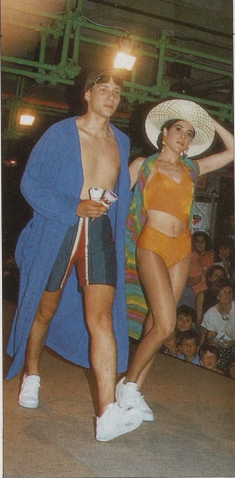
Se presentaron los modelos de 30 alumnas y 10 alumnos.