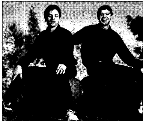
Sergey Brin (i) y Larry Page.