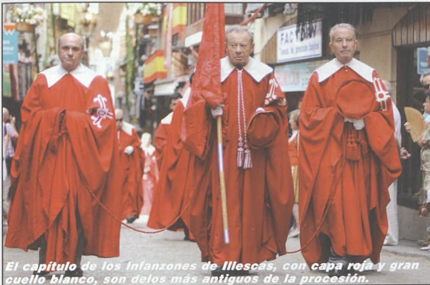
El capítulo de los Infanzones de Illescas, con capa roja y gran cuello blanco, son de los más antiguos de la procesión.

Arzobispo Primado con los obispos auxiliares y los acólitos, con los distintivos arzobispales, y tras ellos las autoridades de la región, la provincia y la localidad, además de la Universidad y las autoridades y banda militar.