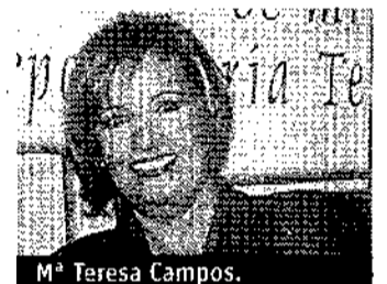
Mª Teresa Campos.