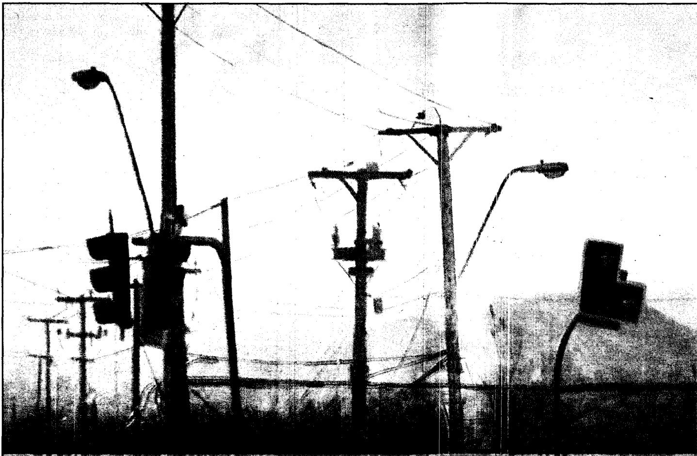
MANUEL TERÁN 2007