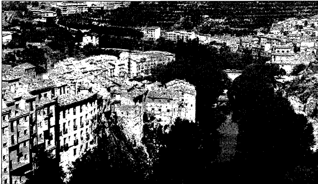
Cuenca goza de un enclave paisajístico único, situada entre las hoces de los ríos Huécar y Júcar

Tras la comida tendrá lugar la recepción oficial en el Salón de Plenos del Ayuntamiento, durante la cual la ciudad de Cuenca quedará plenamente integrada en el Grupo de Ciudades Españolas Patrimonio de la Humanidad. Posteriormente se cerrarán la jornada con un concierto de la Orquesta Filarmónica de Cuenca en el Teatro-Auditorio, sin duda un