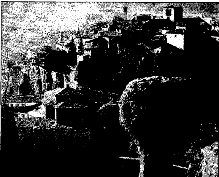
La especial orografía del terreno la dota de una singular belleza

Por ello, esta Asociación, que, conforme a lo establecido en la normativa legal vigente, actúa con plena independencia de cualquier otra asociación, mantiene relaciones de cooperación y colaboración con otras asociaciones españolas, en especial con la Federación Española de Municipios y Provincias y con asociaciones internacionales que tienen finalidades análogas, principalmente con La Unesco. Para concretar esta relación, el 13 de octubre de 1993, bajo la presidencia de Honor de S.A.R. la Infanta Doña Cristina de Borbón, fue suscrito un Convenio Marco de Cooperación con la Comisión Española de La Unesco, cuyo objetivo fundamental era el del establecimiento y delimitación de la forma de cooperación entre ambas partes me-