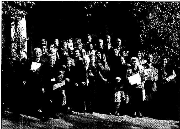
Foto de familia con la treintena de galardonados en el Encuentro.