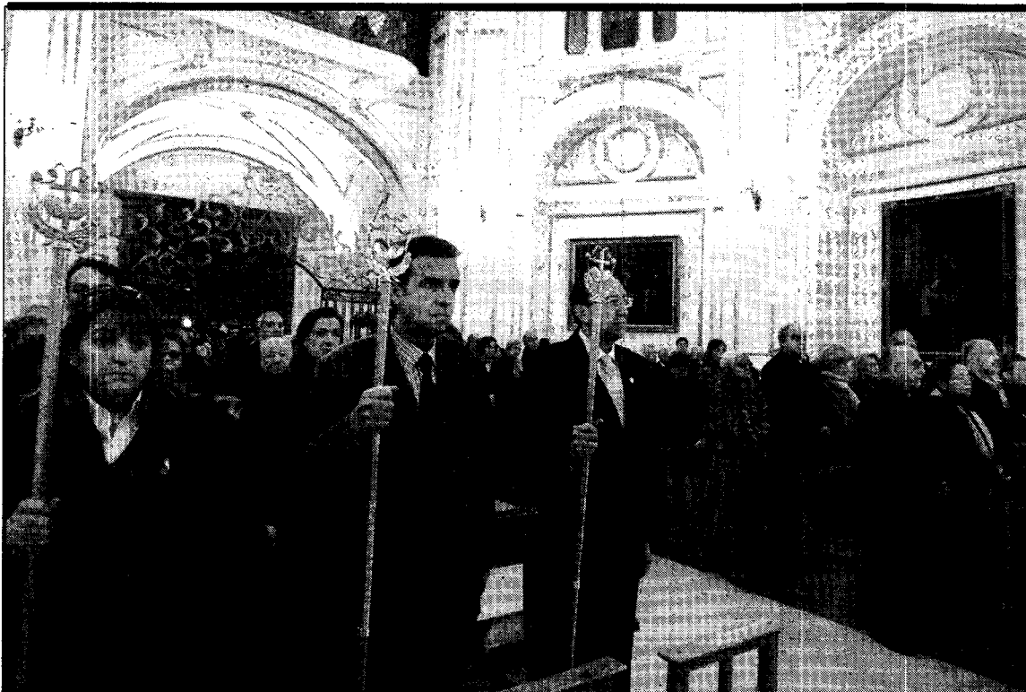
Función de Nuestra Señora de la Esperanza. La hermandad de Nuestra Señora de la Esperanza celebró ayer en la iglesia de las Madres Justinianas ('Las Petras') la función religiosa en honor a la imagen titular de su hermandad. Los hermanos mayores ocuparon un lugar preferente en una ceremonia que estuvo amenizada por la Capilla de Música de El Salvador y Santiago.

Azaleas rojas y rosas, 50 Cyclamen rosas, roja, morada y blanca; 50 Skimia -flor rosa-; 100 Brezos rosas, 100 Prímulas, 50 coles ornamentales flor rosa y otras variedades de diversas especies ornamentales propias de invierno. Supone un aumento considerable en el número de plantas con respecto a la campaña de plantación del año pasado.