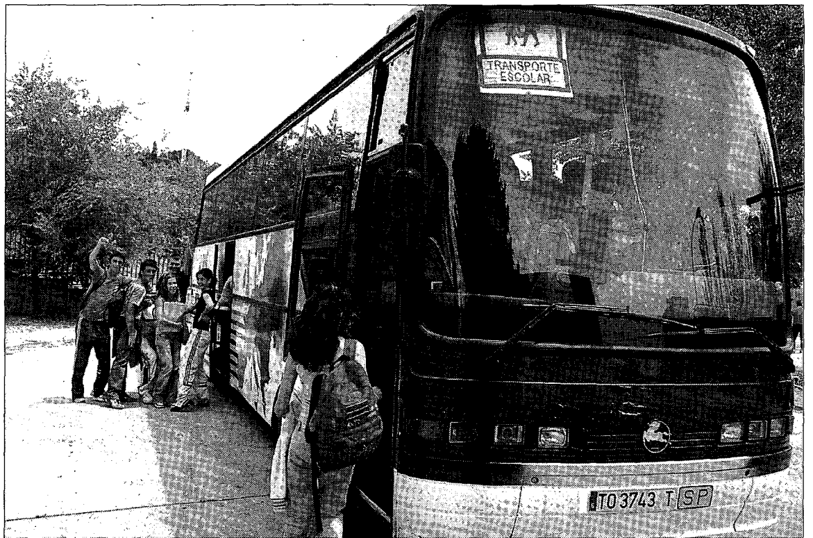
El objetivo es potenciar la participación de todos los sectores de la Comunidad Escolar.

tenciar la apertura de los Centros a su entorno y la participación de todos los sectores de la comunidad escolar, al objeto de un mejor aprovechamiento de los recursos e instalaciones de la localidad. Son susceptibles de ayuda aquellos programas cuyas actividades estén recogidas en la Programación general anual de los centros y que desarrollen contenidos incluidos en una serie de ámbitos.