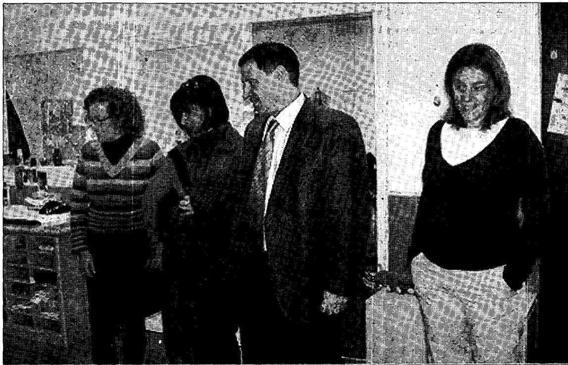
Navarro realizó la visita durante esta semana.

También se pretende cubrir sus necesidades afectivas (seguridad, afecto y figuras de apego), sus necesidades físicas (ofertando la estimulación del mundo motor o del movimiento), sus necesidades cognitivas (estimulando sus procesos mentales, ordenando su atención y observación, sus necesidades sociales (estimulando el lenguaje y los intercambios) o sus necesidades individuales (observación y atención a su ritmo personal y maduración).