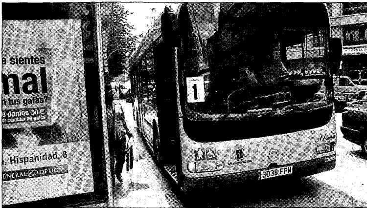
Piden la reedición de una guía que afecta al servicio de autobuses.