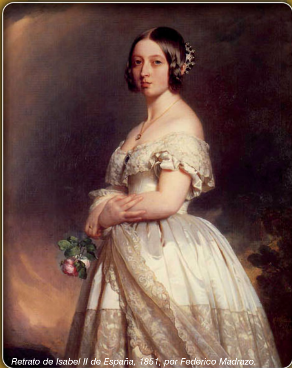
Retrato de Isabel II de España, 1851, por Federico Madrazo.