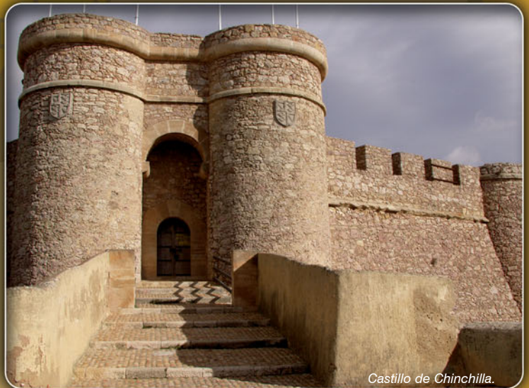
Castillo de Chinchilla.

En 1375 Albacete consigue ser considerada como villa y se independiza de Chinchilla