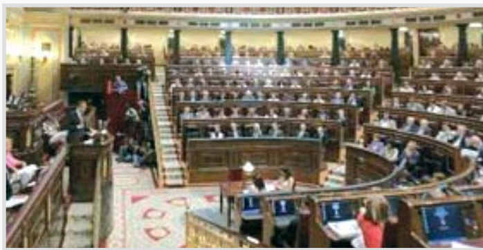
Imagen de la sesión del Congreso de los Diputados

socialistas protestaron la demagogia de Montoro, escandalizaron por esta aseveración a favor de la inmigración del portavoz del PP; el Presidente José Bono le dio su amparo, señalando cómo cada cual tiene su turno; la bancada del PP aplaudió. Paco Fernández Marugán se repreguntó sobre la veracidad de las declaraciones de Cospedal, que presentaba hace unos días al PP como el partido de los trabajadores. Sin una lágrima ni parpadeo alguno Cristóbal Montoro pretendió ganar votos tildando a los presupuestos de derechos. Cosas de España. Terminó pidiendo elecciones anticipadas, ya. Cuánta prisa por gobernar tiene Rajoy; pretende ganar sin aclarar sus intenciones, sin bajarse de su chaise longue , denunció Marugán, portavoz económico del Grupo Parlamentario Socialista.