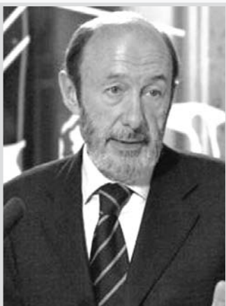
Alfredo Pérez Rubalcaba.

El Vicepresidente primero del Gobierno de Rodríguez Zapatero, Pérez Rubalcaba , en calidad de Ministro de Interior, presentaba el Presupuesto con que hemos de contar en 2011 para garantizar la seguridad ciudadana, 6.000