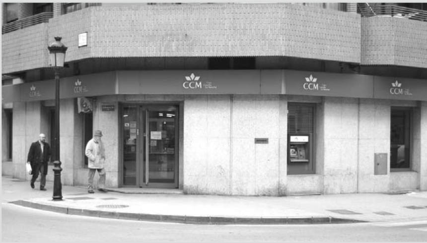
Oficina de CCM, en la calles del Rosario con Pérez Galdós.

CCM cerrará 23 oficinas en Castilla-La Mancha durante el primer trimestre de 2011, dos de ellas, en Albacete, como consecuencia del proceso de reestructuración de la entidad, enmarcado en la integración plena en el nuevo banco, junto con Cajastur, CAM, Caja Extremadura y Caja Cantabria. Las dos oficinas que se cerrarán en Albacete se encuentran en la capital; concretamente, en el cruce de la calle del Rosario con la calle Pérez Galdós; y en la carretera de Madrid, 30, en el polígono Campollano.