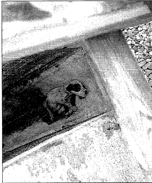
GRUPO MUNICIPAL SOCIALISTA

Desde el Ayuntamiento se ha asegurado que el caso de estos cachorros es «puntual», ya que fueron entregados por un particular que los depositó sabiendo la precaria situación en que se encontraban. El hecho de que fueran llevados a la perrera sin su madre aceleró la muerte de los animales: «El Ayuntamiento rechaza totalmente las acusaciones y seguirá trabajando por mejorar la situación de los perros abandonados dentro del marco del estricto respeto a las normas establecidas», reza el comunicado.