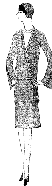
Ha sido empleado «Koata» para la confección de este vestido en el cual el cuerpo es cruzado sobre la falda, estando ambos ribeteados con crepé de China al vies.