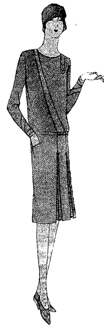
Vestido de crepé «Jorgia» color tórtola donde la confección asimétrica es nueva; los dos vivos en vies sujetan el pliegue delantero de la falda.