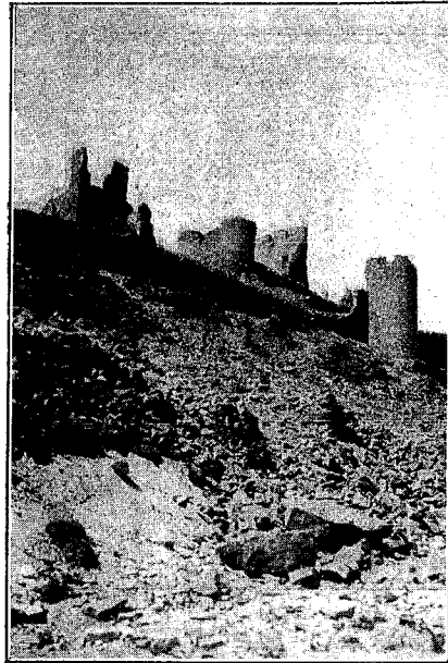
Apenas si queda piedra sobre piedra de aquellas lejanas épocas de recios luchadores y amadores.