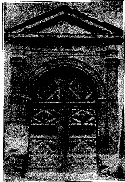
Puerta de la capilla del Hospital con el escudo de los Zapatas