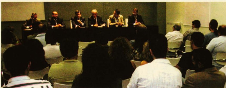
Un momento de la inauguración del curso en Alcázar

El Centro Europeo de Empresas e Innovación (CEEI) de Ciudad Real ha puesto en marcha en este comienzo de curso tres programas formativos para empresarios y directivos de Alcázar de San Juan, Tomelloso y Manzanares, así como sus respectivas zonas de influencia, que versan sobre consolidación y competitividad, auditoría medioambiental y creación y gestión de pequeñas y medianas empresas, que son impartidos por profesores de la acreditada Escuela de Organización Industrial (EOI) y en los que participan más de 70 empresarios, técnicos y responsables de nuestras empresas.