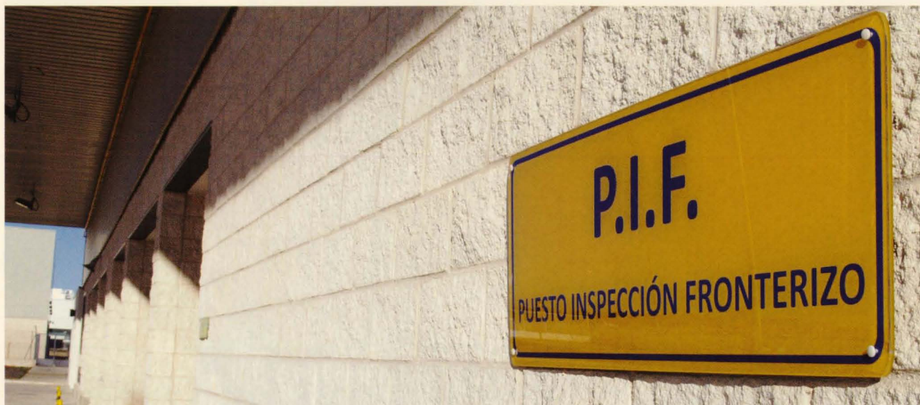
El Puesto de Inspección Fronterizo ya está señalado en el Aeropuerto Central Ciudad Real.