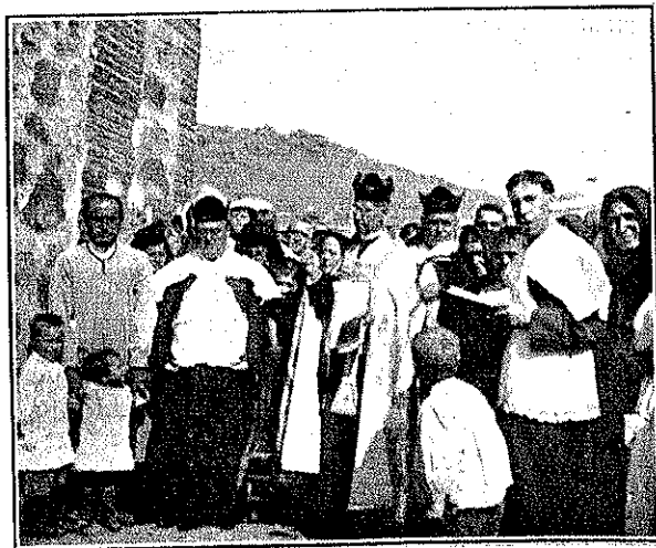
Ofician los sacerdotes...

El templo cerrado y oscuro durante muchos años adquiere vida, animación, hasta diríase que muestra su contento con el incesante volteo de la campana.