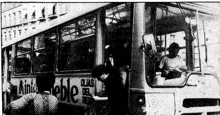
Un inspector de servicios controlará el cumplimiento de los horarios.