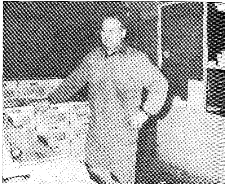
La inspección sanitaria ha de hacerse por muestreo