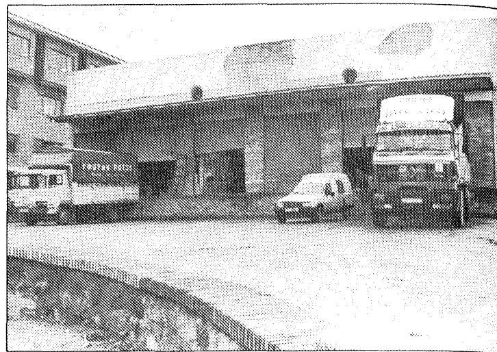
En el mercado actual trabajan diez mayoristas