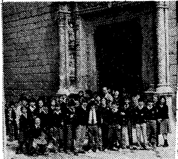
Diez colegios visitaron a lo largo de la mañana el museo de Santa Cruz. Los niños fueron los verdaderos protagonistas de la jornada.

Los jóvenes que visitaron el museo se mostraron bastante interesados en todo lo que se les había mostrado en el mismo, y uno de ellos nos contaba la perplejidad que le había producido los restos del mamut, mientras se preguntaba así mismo: «¿Cómo es posible que se conserve también?». Todos coincidían en que en sus respectivos colegios les llevaban a visitar museos y a que los visiten por su cuenta. Como dato estadístico, el número de visitantes fue de 898