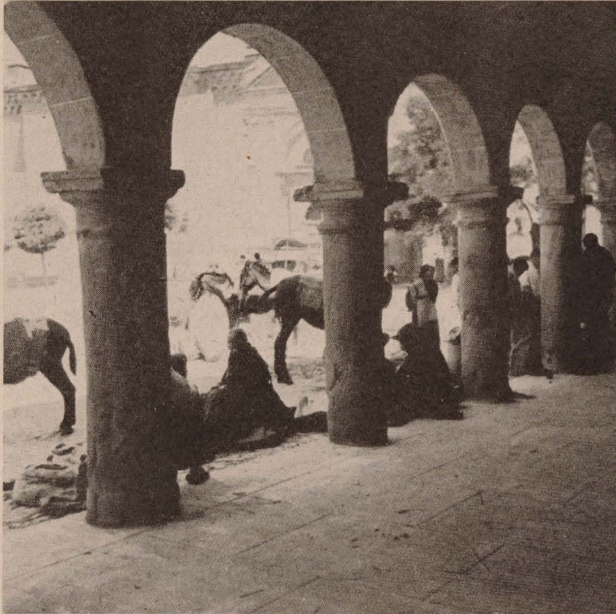
Plaza de Sigüenza antes de la guerra.

tido la geografía ibérica nos salen al paso sus obras magníficas y sus cuadrillas laboriosas, legiones de técnicos y de obreros que le van devolviendo a la Patria su perdida fisonomía.