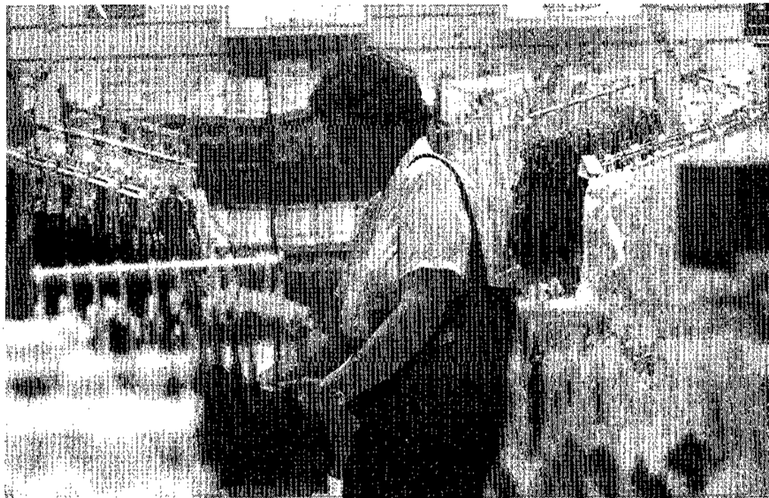
Los comercios de la región están preparados para la llegada del euro.