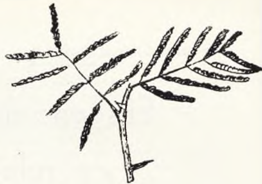
Acacia en posición de vigilia y sueño,

por la noche —como ya había observado Plinio en las aguas tranquilas del Eufrates— esconde sus lindas flores en el seno de las aguas tranquilas del Nilo para surgir al exterior con los primeros rayos de la aurora. Por lo cual aquel antiguo pueblo consagró y dedicó esta planta al astro rey.