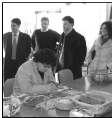
Visita de los Talleres del Centro Ocupacional