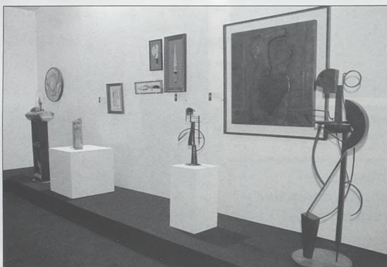
Las piezas finalistas en las cuatro modalidades de los premios regionales de artesanía se pueden ver en dos stands de la Fundación Mezquita de Tornerías, a la entrada de Farcama.