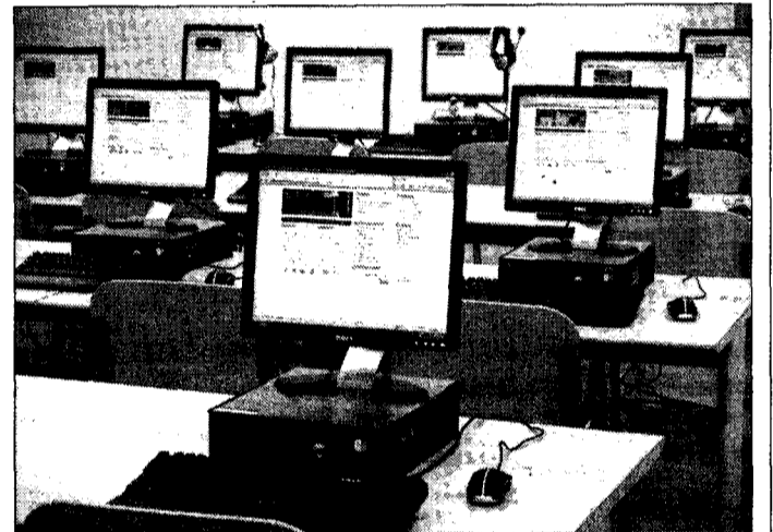
El 88,5% de las microempresas utiliza la banda ancha.

En los últimos porcentajes, aparece Cantabria, con el 84,85 de las microempresas, y con cifras inferiores al 80%, aparecen las comunidades autónomas del País Vasco y Navarra, según el informe 'Tecnologías de la Información y la Comunicación en la Microempresa Española' de Red.es. En el caso de la existencia de ordenadores, la mayor proporción entre las microempresas se encuentra en la Comunidad Valenciana, con un 68,3%. Después irían las comunidades de Madrid (66%), Andalucía (62,4%), País Vasco (60,8%) y Cataluña, con un 60,2%. Por debajo aparecen Cantabria (53,9%), Navarra (53,4%), Asturias (53,1%) y Castilla-La Mancha, con un 53%.