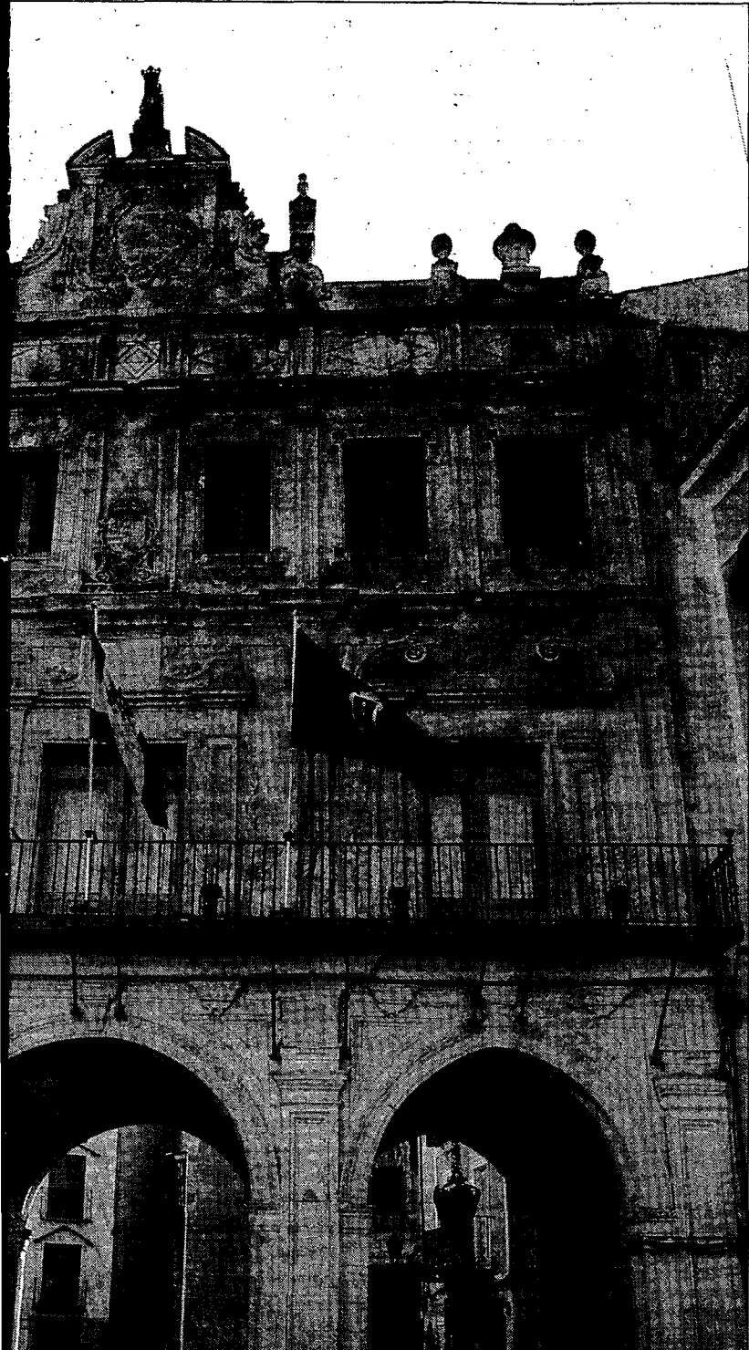
Ayuntamiento de Cuenca.