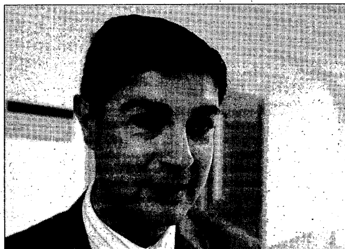
El presidente de la Diputación provincial, Juan Ávila.

En un segundo momento, y aunque está por concretar y desarrollar, se podrán ir alcanzando acuerdos puntuales entre ambas entidades, según los proyectos y acciones que vaya elaborando ANFAC.