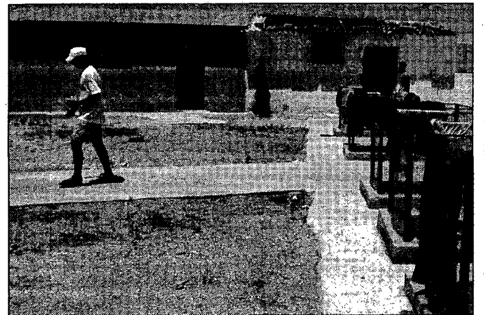
Una campaña mejorará la imagen de los inmigrantes.

A las diez y media de la mañana un grupo de alumnos presentará en el Ayuntamiento un trabajo que ha realizado sobre el tema de los derechos humanos. Está anunciado que acuda el alcalde de Cuenca, Francisco Javier Pulido, para escuchar la exposición.