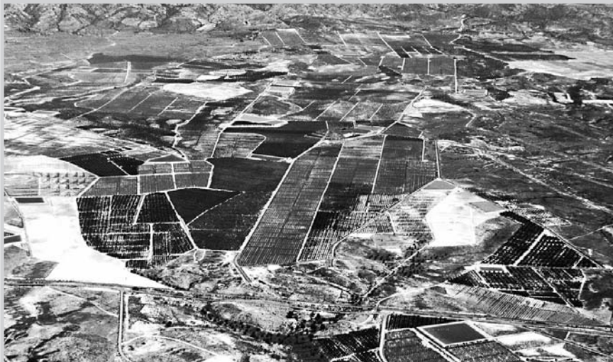
Parcelas regables en el Sureste.