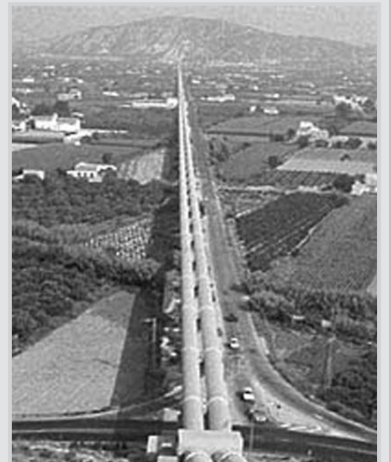
Canalizaciones de trasvase.

“Estamos en una situación grave; si el tiempo no lo impide, es posible que en agosto tengamos muchas restricciones para beber agua en los hogares de Castilla-La Mancha y Murcia”, vaticinó. Añadió que si en Murcia existe un “descontrol” en el uso del agua, “no lo tenemos que pagar los demás”.