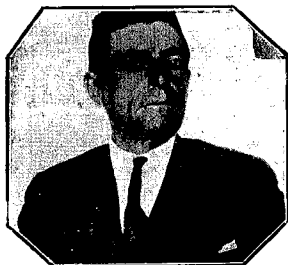
Villapalacios.—El prestigioso Alcalde don Pedro Rodríguez Pajares, que tan brillante gestión viene realizando.