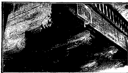
Villapalacios.—Un detalle del magnífico tallado del coro.