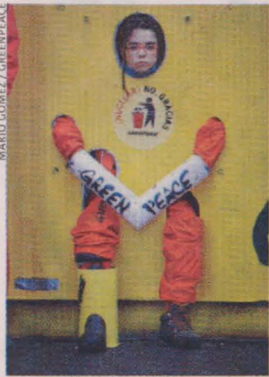
Los activistas se encadenaron para cortar el paso.